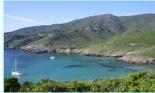
Désert des Agriates

Géologie : Faisant partie de la région géographique italienne, la Corse se situe avec la Sardaigne sur une microplaque continentale. C'est au cours de l'Oligo-Miocène (au milieu du Cénozoïque entre environ 22 à 25 millions d'années) que le bloc corso-sarde et la lanière continentale s'écartent progressivement du bloc ibérique, ouvrant derrière eux le bassin provençal, la mer d'Alboran, le bassin algérien et la mer Tyrrhénienne. La dynamique cesse avec le blocage de l'arc contre les domaines externes, apulien et africain.