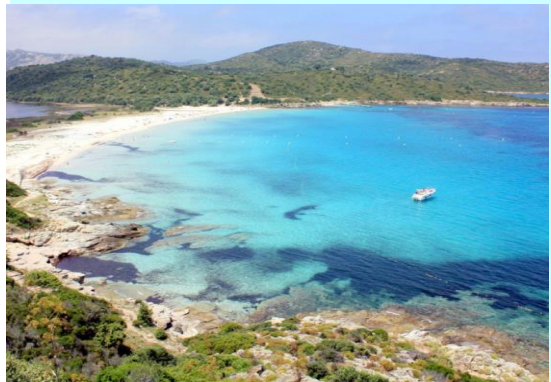
Plage du Lotu

-1500/-1300 : début de la civilisation torrénienne. Les Korsi développent la construction de statues-menhirs (Filitosa) et de tours.